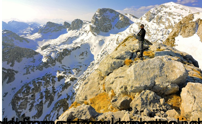
Planina je bila vrlo lijepa i zanimljiva. U planini su se nalazili snježni pokriveni vrhovi i planinski vrhovi. U planini su se nalazili snježni pokriveni vrhovi i planinski vrhovi.