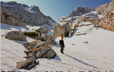
Prvi dio puta, od planinarske kuće do planinarske kuće. U planini su se nalazili snježni pokriveni vrhovi i planinski vrhovi. U planini su se nalazili snježni pokriveni vrhovi i planinski vrhovi.