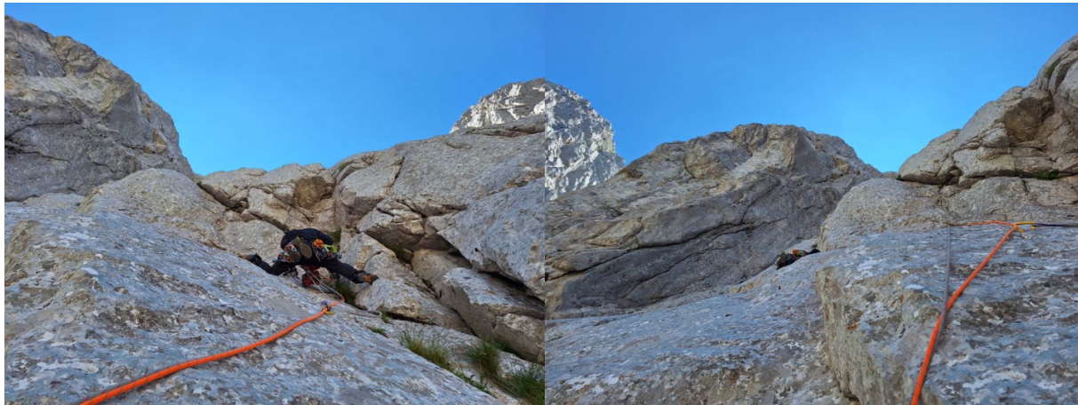
5. Detalj iz 6tog cuga, VI A0, slobodno VII, 35m.

djeluje ni malo lako, te ipak stajem i bušimo još jedan bolt. Uz puno balansiranja prebacujem se u lijevo, i idem dalje. Postavim više klinova i frendova, a u završnom dijelu ploče su glatke i teško mi je da napravim korak više. Ipak stajem na klin i nekako hvatam vršni dio pukotine. Da sam bio u prilici da se vratim vjerovatno i bih jer ne penjem tako teško, osim kad se mora i nema nazad. Iza mene prolazi Novica slobodno i ocjenjuje detalj sa VII a za nama i Bojan kojem nije padalo na pamet da vadi klinove, a i kreće priča o njegovoj penjačkoj penziji, a koja zbog dobre šale na taj račun podiže moral.