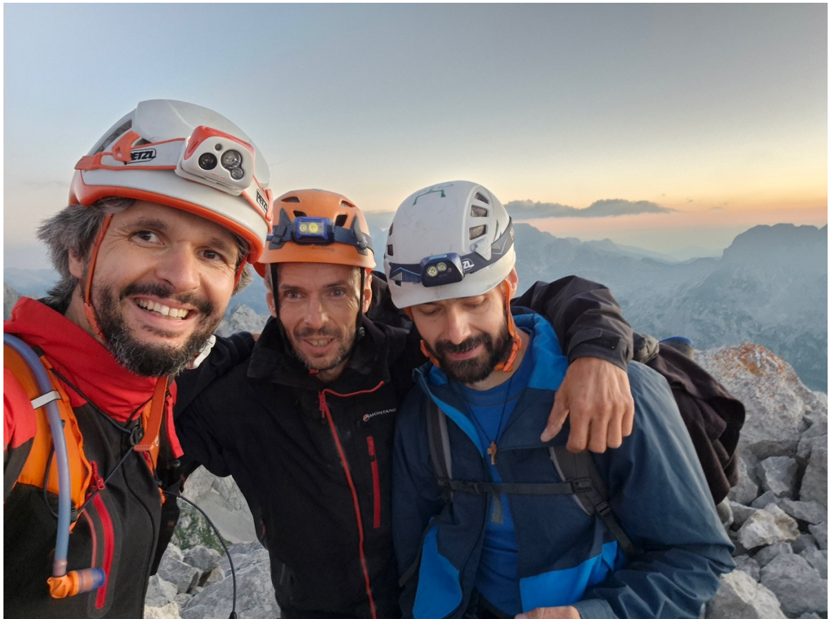
11. Moćna ekipa.

Sa vrha se otvara pogled ka Maja Jezercetu i jezerima u dolini.