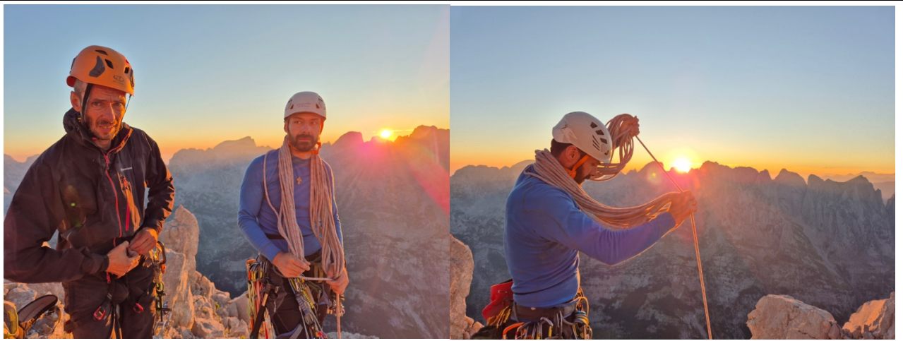
10. Na vrhu grebena.

Srećni i umorni, zadovoljni što smo po danu izašli iz stijene jer je nbio realan i rizik od bivaka, pakujemo opremu i kratko grebenom idemo do vrha.