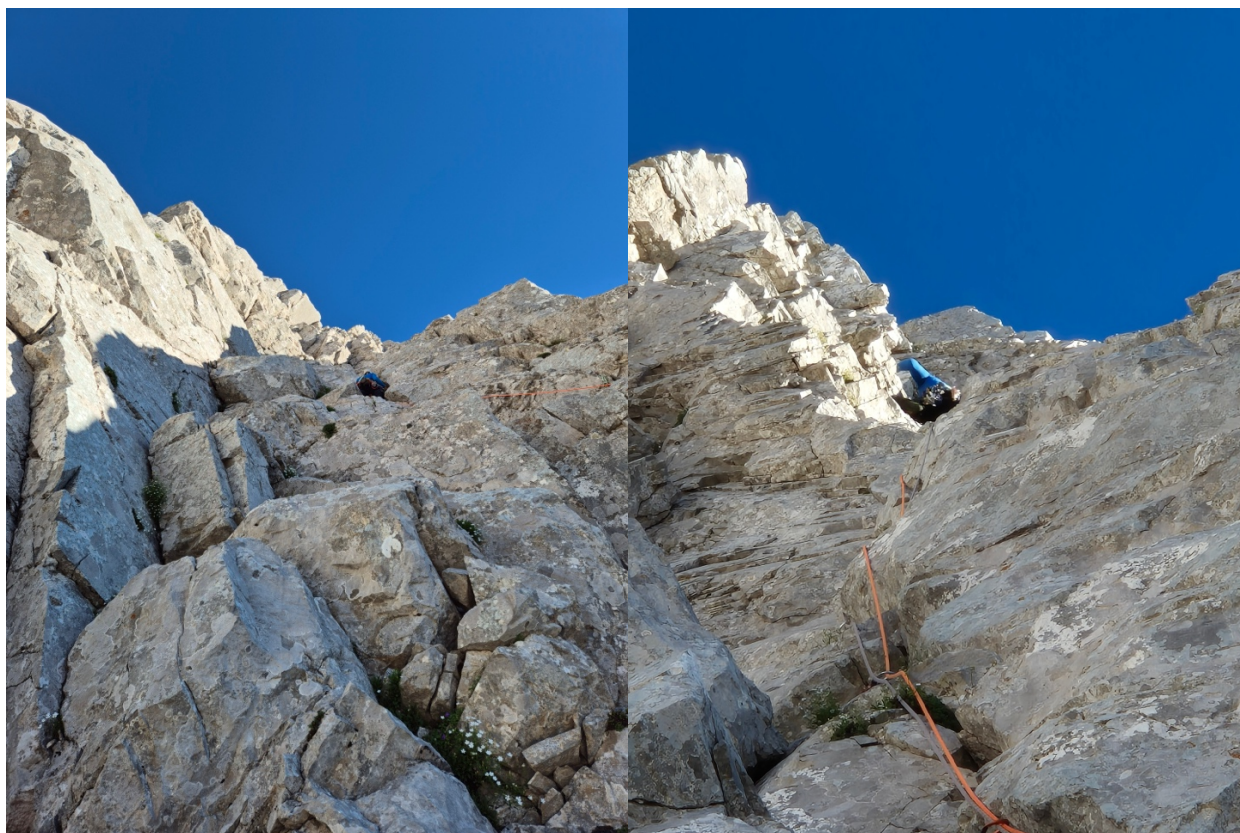
9. Detalji iz 11tog cuga, i malo vertikalno i krušljivo.

Uočavam moguću traverzu i otklanjanje u desno, oko manjeg stebra na lakši teren, te zbog manjka vremena koristimo priliku da izadjemo brže iz smjera. Sa druge strane teren je ovdje izrazito krušljiv, prvi cug vertikalno i krušljiv. Sledeća dva završna cuga su lakša ali i samo kretanje užeta pokreće kamenje koje nas zasipa odozgo, srećom promašuje, u jednom trenutku je bila prava kanonada.