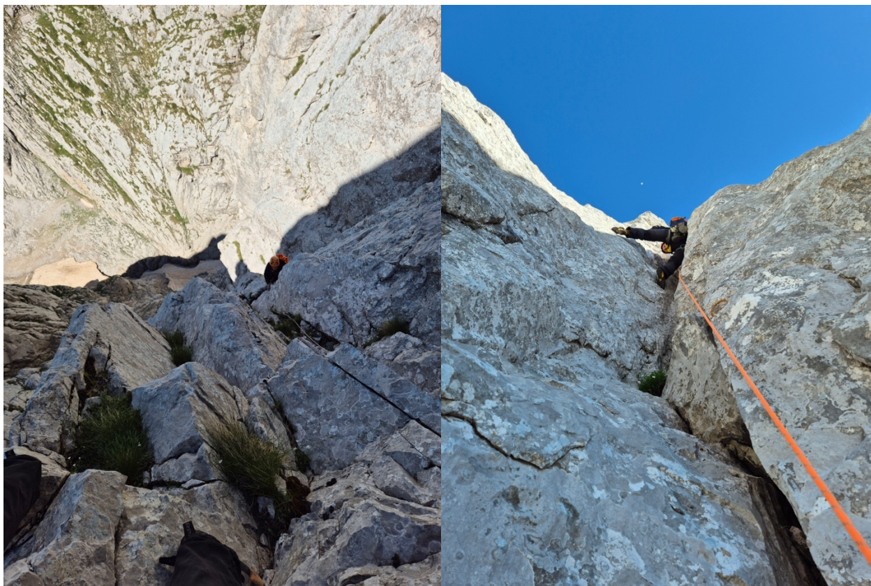
6. Eksponirano penjanje u 7mom cugu.

Sledeći cug nas pozicionira tačno ispod plafona, koji obilazimo sa desne strane. Tu na sidrištu ostaje bolt, a Novica se premješta 2 m u desno, iza ivice stijene, i pravoo gore preko ploča. U tom dijelu postavlja 4 bolta. Dok sam slušao rad bušilice, jedan bolt za drugim znao sam šta nas čeka. Ta sledeća dva cuga, desno od plafona, nude super lijepo i eksponirano penjanje, te je osjećaj fenomealan.